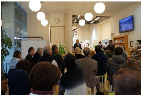
株式会社トキワさんにて