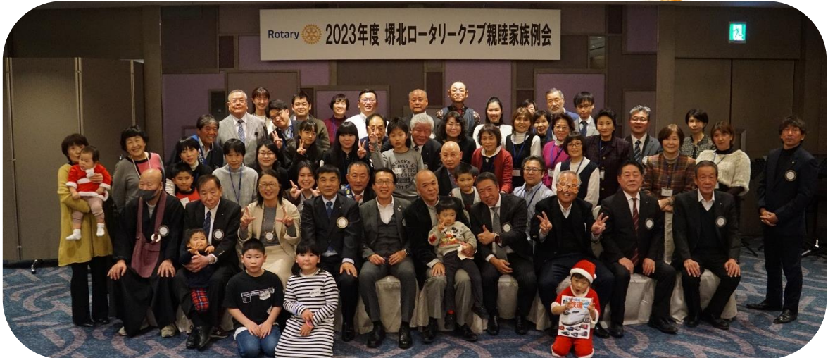
総勢63名のご参加で 盛会に終了いたしました。 ありがとうございました！