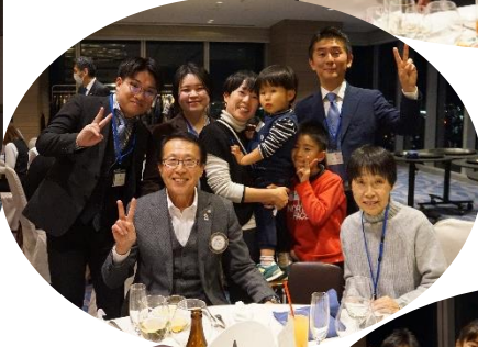
よい子のみんなにもサンタさんからプレゼントが届きました♪