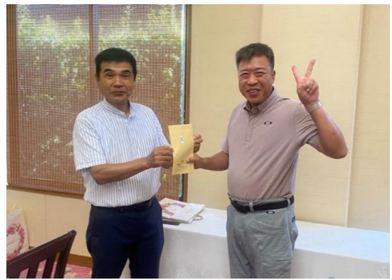
藤永準会員 優勝おめでとうございます！