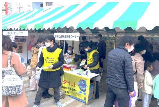
「ダメ・ゼッタイ」薬物乱用防止啓発活動