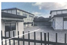
出雲大社 大阪分祠内 大阪春場所 宿舎