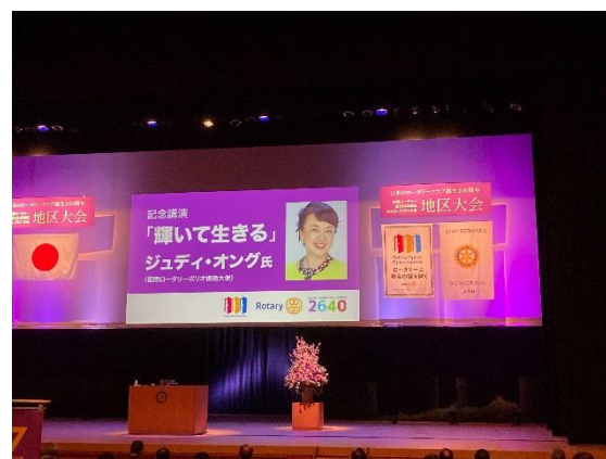
記念講演 国際ロータリーポリオ根絶大使 ジュディ・オング氏