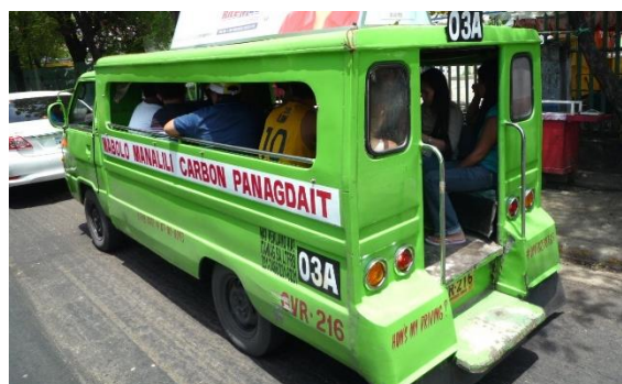
庶民の足 ジブニー 乗合いバス