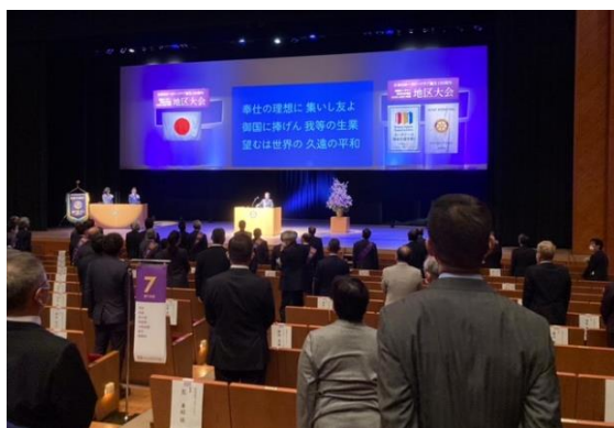
十分なソーシャルディスタンスで開催

地区大会の様子は後日動画配信される予定のようですので、詳細が届きましたらお知らせいたしますので是非ご覧ください。