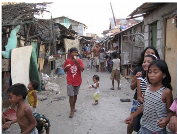
下流階層の街並み