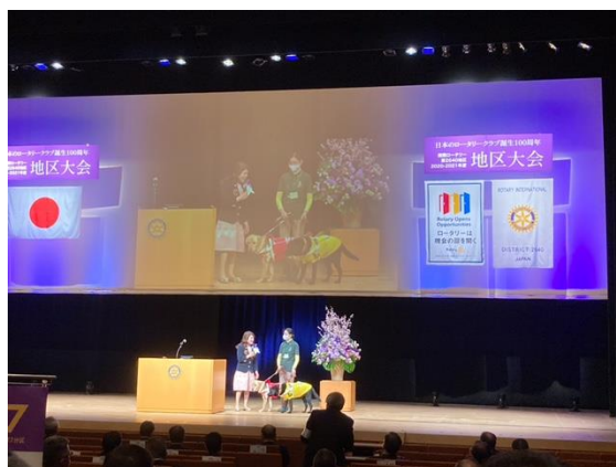
日本ライトハウス 盲導犬紹介