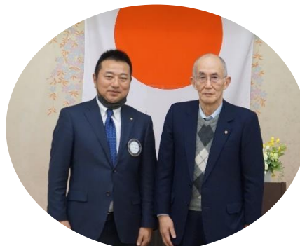
木畑会長代理よりRCバッチの贈呈がありました