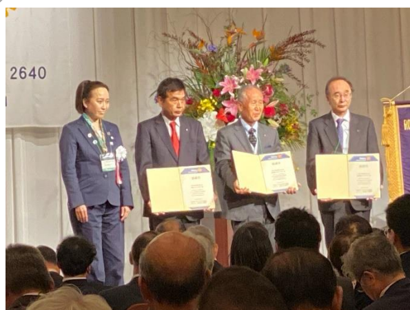
表 彰 (対象2018-2019年度)