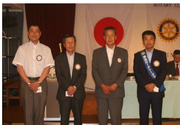
パストバッチ 授与