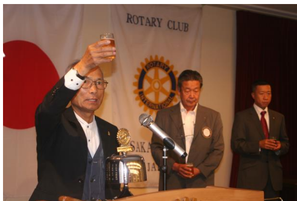
新井会員 乾杯のご挨拶