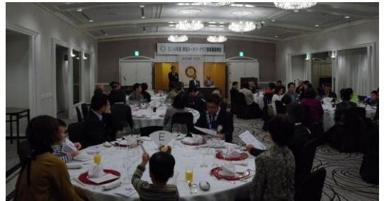
たくさんご参加いただき盛会となりました。