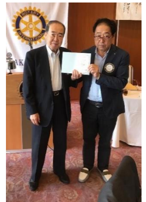
濱口会員 米山功勞者 第63回メジャードナー おめでとうございます！