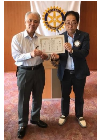
山中会員 基金表彰ゴールドファンデワロー 皆出席表彰、おめでとうございます！

今週の歌「うみ」 松原遠く消ゆるところ 白帆(しらほ)の影は浮かぶ 干網(ほしあみ)浜に高くして かもめは低く波に飛ぶ 見よ昼の海 見よ昼の海 島山闇に著(しる)きあたり 漁火(いさりび)光り淡し 寄る波岸に緩くして 浦風軽(かろ)く沙(いさご)吹く 見よ夜の海 見よ夜の海