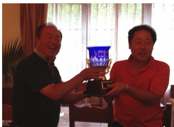
優勝 辰会員 おめでとうございます！！