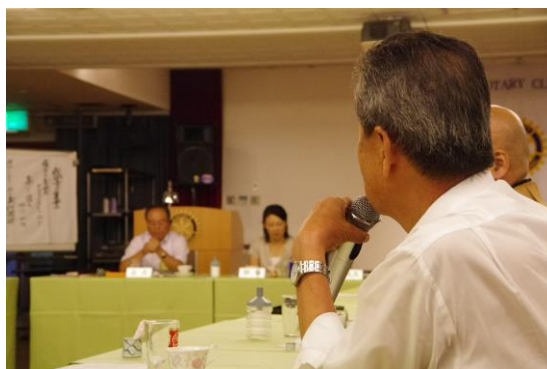
テーブル会議中のひとコマ